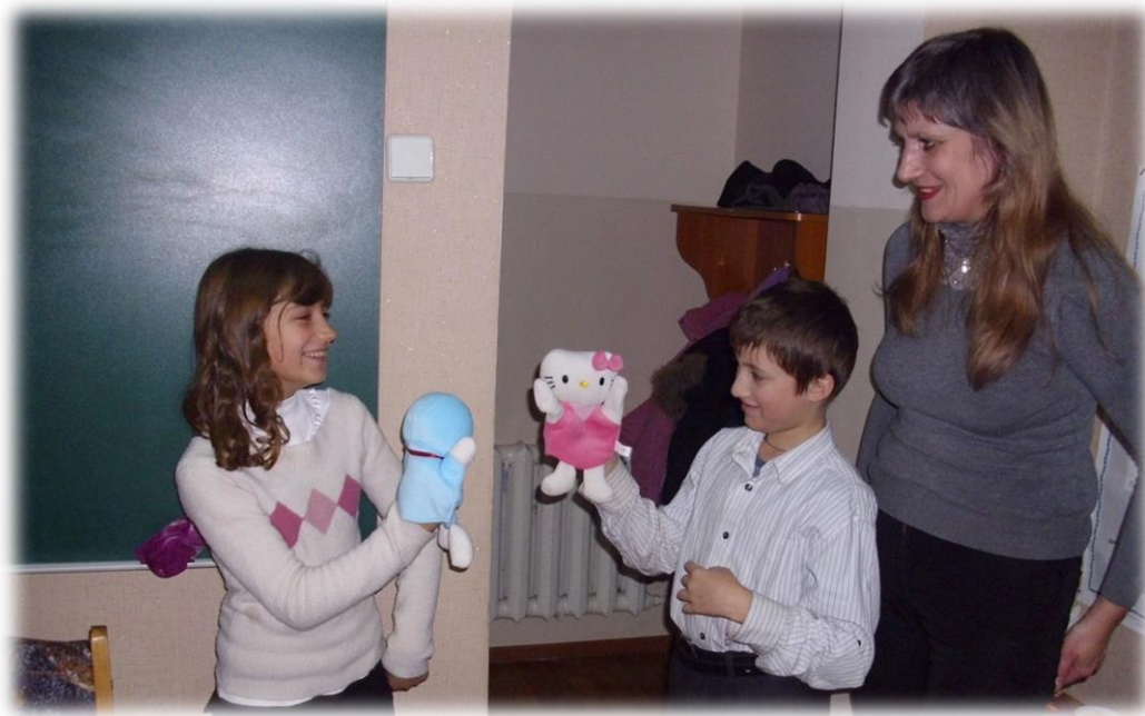
Фрагмент театральної драматизації при закріпленні звуків у мовленні.

індивідуальні, багатоваріантні і різні за ступенем творчого самовираження. Отже, використання елементів корекційно-компенсаційних психотерапевтичних технологій розвиває загальнонавчальні вміння. Це вміння вчитись жити, вміння пристосовуватись до мінливих умов через взаємовідносини дорослий – дитина, в ході яких напрацьовуються необхідні якості; – інтелектуальну сферу, швидкість і гнучкість мислення логічного, критичного, креативного, інтуїтивного; – емоційно-вольову сферу, працездатність, поведінку: дитина навчається керувати собою, своїми емоціями.